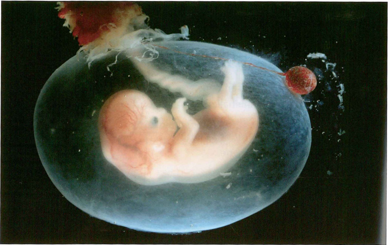
Her er fosteret sju til åtte uker.